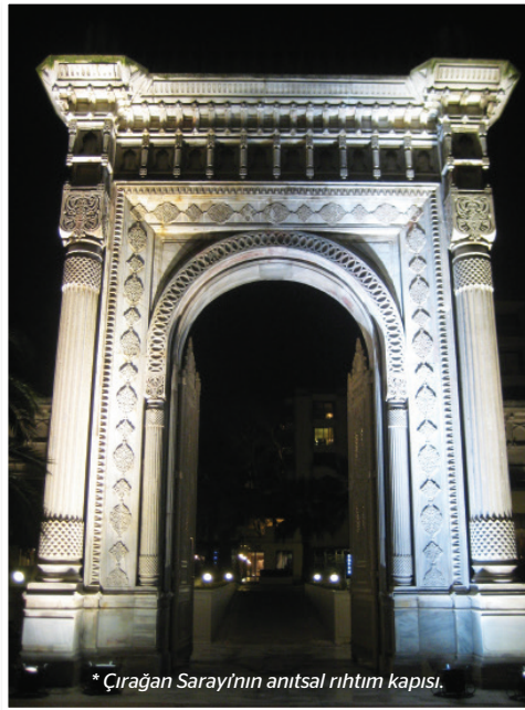
* Çırağan Sarayı'nın anısal rihtım kapısı.

Bu satırları kaleme alırken, Çırağan Kempinski'nin Kültür Ataşesi Ayşe Sipahioğlu'nun pek çok kere davetlisi olarak sarayı ziyaret edip bale projesinin geçirdiği safhaları coşkuyla karşılıklı paylaştıktan sonra bir defasında, doğum günümde, akşam vakti tek başıma rihtımdaki o anısal kapının altında durup sonradan balenin afişinde yerini alacak olan o tek kare yalın kapı fotoğrafını çektiğimi ve aynı an elimde Savaş Camgöz'ün hazırladığı ve şu an karşımdaki ampir kütüphanemin içinde duran o rihtım kapısının strafordan yapıma maketini tuttuğumu hatırlıyorum. Bütün bu hisler balenin hazırlık aşamasında Ankara-Londra arasında mekik dokurken yaptığım seyahatlerden bir tanesinde uçakta Oscar Wilde'm The Portrait of Mr. W. H. adlı hikâyesini okurken altını çizdiğim şu satırları bana anımsatıyor: "Bütün sanat bir yerde bir tür tiyatro oyunu oynamak gibidir; insanın kendi kişiliğini gerçek hayatın kısıtlamalarından, ona tuzak kuran kazalardan uzak bir hayâl âleminde canlandırmasıdır". Ne kadar da doğru diye düşünüyorum kendi kendime... A